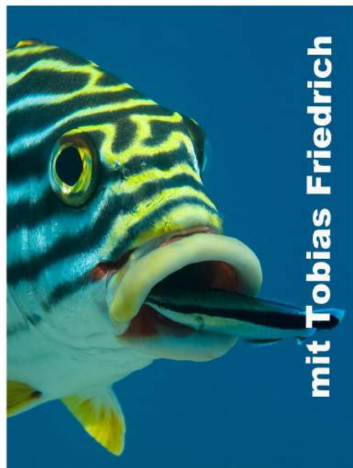
mit Tobias Friedrich

1. Deutscher Unterwasser-Fotoclub Bietigheim - Bissingen e. V.